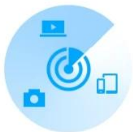
Home Network Scanner